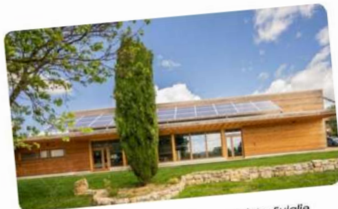
Foyer communal de Garrigues-Sainte-Eulalie

La deuxième session du 15 mai a été accueillie au foyer communal de Garrigues-Sainte-Eulalie, un foyer combinant rénovation et production d'énergie renouvelable parfaitement dans le thème de la session : production énergétique .