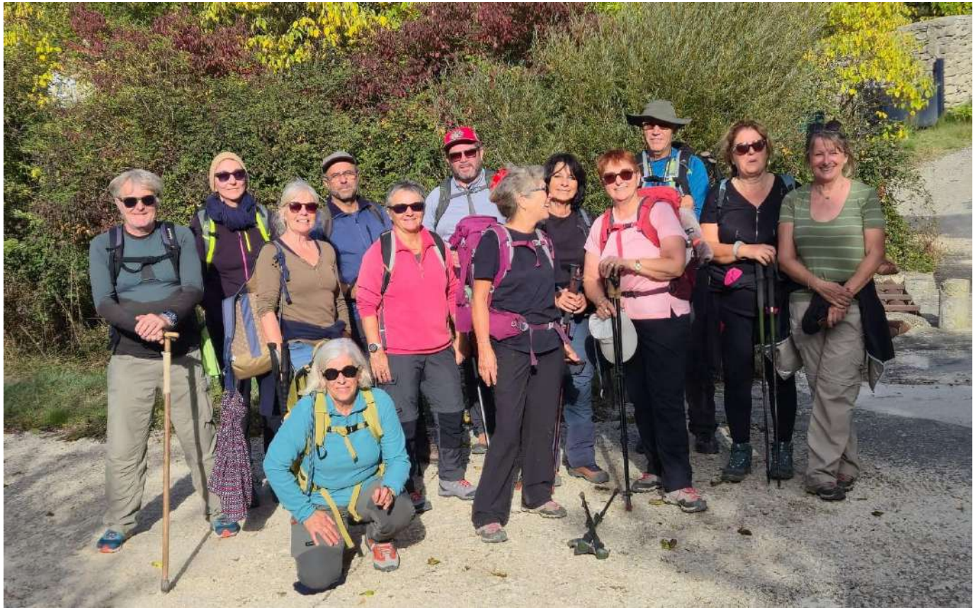
Rando Mas de l'ancienne église

Nos dernières randos : Col du Mercou, Souvignargues, Mas de l'ancienne église à Belvezet, Durfort, Vallée de l'Eure également randos à la demi-journée autour de Garrigues...La rando prévue à St Victor la Coste a dû être annulé pour mauvais temps et sera reportée en 2026.