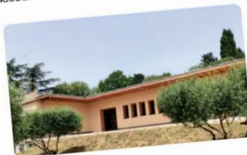
Café de pays multiservices

L'après-midi du 15 mai s'est poursuivie par une visite terrain du café pays multiservices , fabriqué également à partir de matériaux biosourcés.