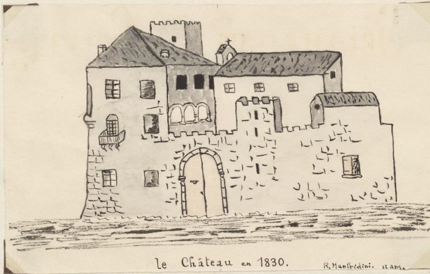
Le Château en 1830.

C'était un château-fort redoutable dressé sur un plateau, taillé à pic du côté du levant, entouré de larges fossés et de hautes murailles, flanqué de quatre tours et défendu par deux pont-levis. Certains font remonter la ruine du château fut à 1793 mais il est probable que le château fut transformé en 1719 lorsque les seigneurs de Gaude le vendirent à Antoine Malarte bourgeois de la ville d'Uzès.