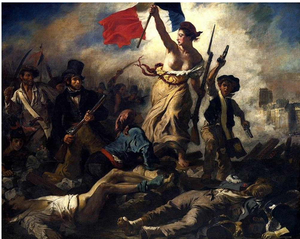
La Liberté guidant le peuple, 1830 – Eugène DELACROIX

Tous ensemble, mobilisons-nous pour soutenir nos communes sur MaCommuneJy-Tiens.amf.asso.fr