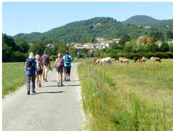
Retour à Lasalle en fin de rando.