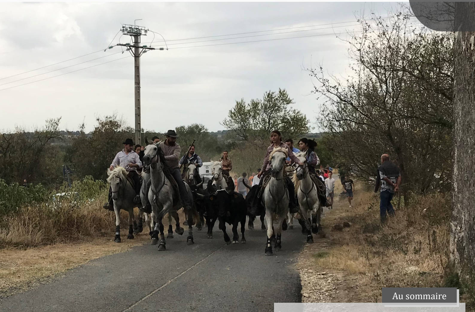
Septembre 2019