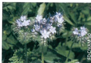
Exemple d'engrais vert la phacélie