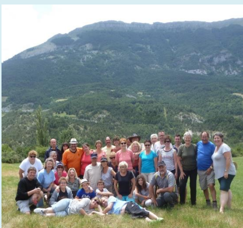
Drôme le 8 juillet

La saison 2016/2017 s'est achevée avec une marche depuis Poulx jusqu'au Gardon le 18 juin et un WE en Drôme provençale les 8 et 9 juillet.