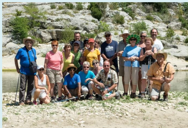
Poulx le 18 juin

La saison 2017/2018 débute pour notre association en septembre avec les marches familiales de Blauzac, circuit des Capitelles le 17, le chaos de Nîmes le Vieux le 15 octobre, St-Gilles le 19 novembre et Nages le 17 décembre. En sus de ces marches familiales, nous irons aux Calanques de Cassis le 1er octobre et à Méjannes le Clap le 5 novembre.