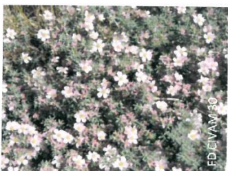
Exemple de plante couvre sol : Franckenia laevis

Pour une occupation plus pérenne, on peut privilégier les plantes couvre-sol méditerranéennes. Elles sont adaptées au climat, résistantes, créent un micro climat et permettent d'abriter une forte biodiversité, notamment des auxiliaires (prédateurs des ravageurs) qui pourront survivre en hiver grâce à l'abri des couvre-sols. Pailler jusqu'à ce que les feuillages couvrent entièrement la surface donne un excellent rendement à cette méthode. Et même si quelques herbes traversent cette couche végétale, elles se remarqueront à peine ! De nombreuses plantes couvre-sol existent, à vous de choisir en fonction de l'esthétique, des conditions de sol, de lumière et du piétinement.