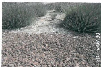
Exemple de paillage : paillettes de chanvre et pouzzolane