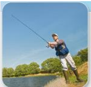
Vous pratiquez la pêche.