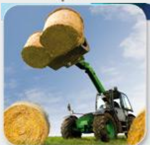
Vous êtes agriculteur.