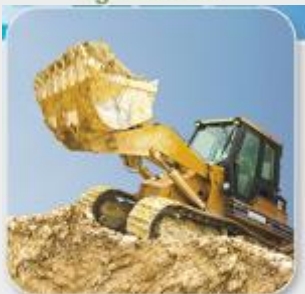
Vous travaillez sur des chantiers.