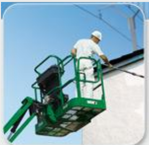
Vous utilisez du matériel de location.

Les risques liés aux lignes électriques nous concernent tous et le réseau de transport d'électricité (R T E) a créé un site internet qui rappelle tous les risques liés aux lignes électriques et les précautions à prendre vis à vis de ces risques.