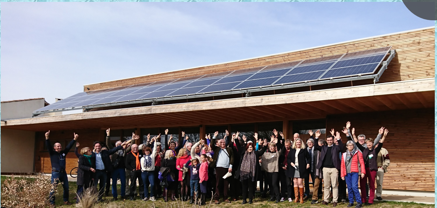
Inauguration des panneaux solaire du foyer communal - Janvier 2019